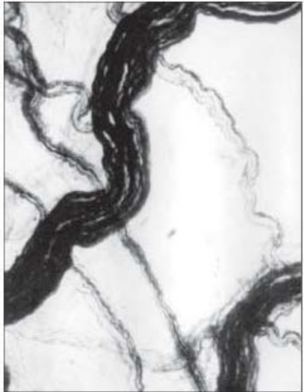
Рис. 2. Венозний синус серця собаки. Пучки нервових волокон, що утворюють сплетення. Більшовський-Грос. Об. х3,5, ок. х12,5.