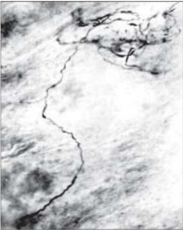
Рис. 3. Устьовий відділ легеневого стовбура серця кота. Рецептор з обмеженим характером розгалуження. Більшовський-Грос. Об. х8, ок. х10.