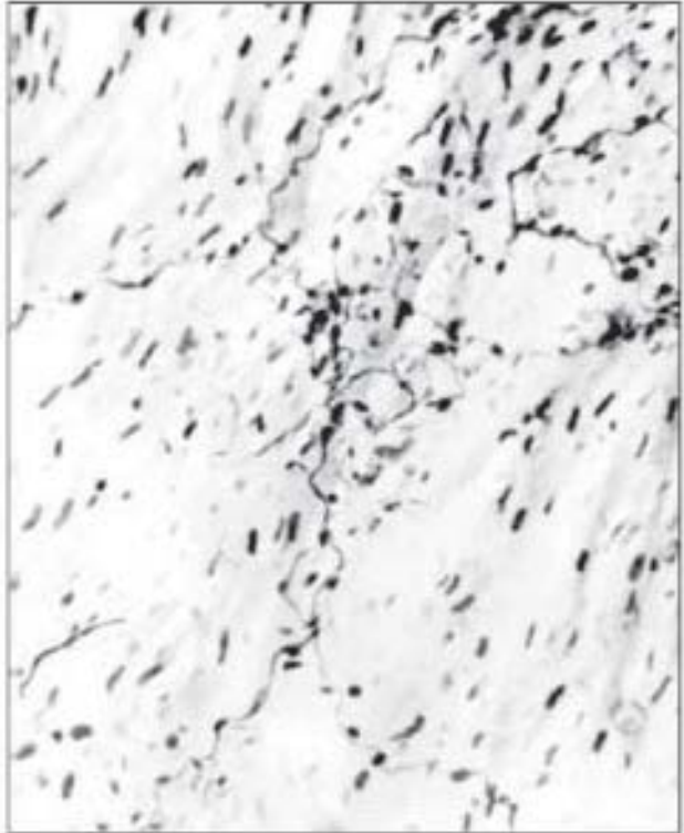
Рис. 4. Легеневий стовбур кота. Нервове закінчення з дифузним розгалуження терміналей. Більшовський-Грос. Об. х9, ок. х12,5.