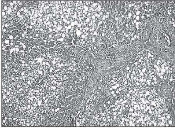
Рис. 3. Неалкогольний стеатогепатит. Дифузний мікро-, макровезикулярний стеатоз печінки понад 66% площі (III ступінь). Портальний та септальний фіброз печінки. Мікропрепарат. Забарвлення за методом М.З.Спінченка. Зб. \times 17,5 .

У хворих на НСП із ЦД типу 2 на тлі переважно мікровезикулярного стеатозу гепатоцитів було встановлено фіброз змішаного типу з ознаками перичелюлярного, перисинусоїдального, централобулярного та фокального чи екстенсивного портального фіброзу 3-ї зони зі слабо вираженими ознаками поліморфноклітинної інфільтрації. Визначалося потовщення та вогнищева гіалінізація Гліссонової капсули. ПГ у хворих на НСП становила 234,13 \pm 11,55 мкм 2 , ПСТ – 28,72 \pm 1,71 мкм 2 , СПС – 0,12 \pm 0,003 . У 35% випадків НСП зареєстровано розширення зони фіброзу навколо портальних трактів з вогнищами гіалінозу. Синусоїди – переважно щілиноподібної форми, подекуди спостерігалася їх капіляризація, просвіт синусоїдів звужений. ІФ при I-й стадії становив 3,2 \pm 0,12 , II – 4,0 \pm 0,21 , III – 5,4 \pm 0,15 , що вірогідно перевищувало показники у I та II стадіях, а також ІФ при АСП ( p < 0,05 ). Отже, у хворих на НСП встановлено переважання дифузного фіброзу (перичелюлярного, перисинусоїдального, централобулярного типів) печінкової тканини, який не був наслідком некротичних змін гепатоцитів у минулому.