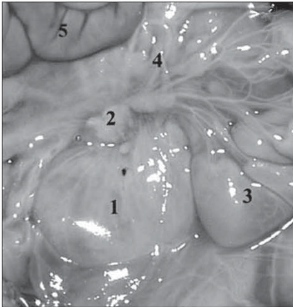
Рис. 1. Органи черевної порожнини у новонародженого (брижа тонкої кишки зміщена краніально). Макропрепарат. Збільшення 1,4

(12 випадків). Права ободовокишкова артерія простягається косо (зверху вниз, зліва направо) по передній поверхні нижнього вигину ДПК в напрямку висхідної ободової кишки. Брижа тонкої кишки покриває нижню третину низхідної частини, горизонтальну частину (рис. 1) і дванадцятипало-порожньокишковий вигин. Корінь брижі має косий напрямок (зліва направо, зверху вниз). Задньою поверхнею ДПК щільно фіксована до задньої черевної стінки.