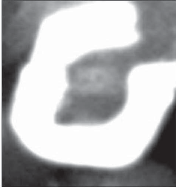
Рис. 3. Фоторентгенограма дванадцятипалої кишки новонародженого, заповненої рентгеноконтрастною сумішшю. Збільшення 1,6.

При рентгенологічному дослідженні верхня частина ДПК кільцеподібної форми визначається на рівні тіла I поперекового хребця (рис. 3). Верхній вигин знаходиться правіше хребетного стовпа на рівні I поперекового хребця. Низхідна частина прямує справа вздовж хребта від рівня нижнього краю тіла I до нижнього краю тіла III поперекових хребців. Нижній вигин ДПК знаходиться в проекції III поперекового хребця. Горизонтальна частина визначається перпендикулярно до хребта на рівні міжхребцевого проміжку між III і IV поперековими хребцями, утворює каудальний вигин. Проекція висхідної частини визначається зліва від хребетного стовпа, в проекції поперечних відростків III-II поперекових хребців, дванадцятипало-порожньокишковий вигин – на рівні міжхребцевого проміжку між I і II поперековими хребцями.