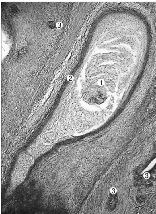
Рис. 2. Сагітальний зріз передміхурової залози плода 270,0 мм ТҚД. Забарвлення гематоксиліном і еозиним. Мікропрепарат. Об. 3,5, ок. 10: 1 – вміст порожнини передміхурового мішечка; 2 – стінка передміхурового мішечка; 3 – залозисті утворення передміхурової залози.

них борозен, коливається від 5 до 11. З боку бічних стінок передміхурової частини сечівника відкривається найменша кількість залозистих утворень (3-14) у порівнянні з іншими стінками. На цій стадії спостерігається зменшення розмірів залозистих утворень передньої стінки сечівника, а також редукція деяких з них. Кількість залозистих утворень передньої стінки сечівника становить 11-14. Спостерігається процес перетворення залозистих ходів у трубчасті, що є вивідними протоками ПМЗ. Залозисті ходи ПМЗ вистелені багатошаровим кубічним епітелієм.