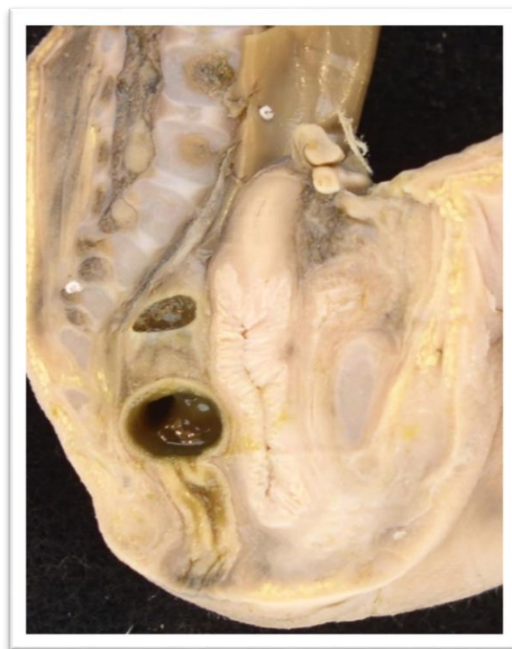
Рис. 2. Сагітальний розріз плода 350,0 мм ТКД 1 – поперековий хребець; 2 – крижовий хребець; 3 – міжхребцевий отвір; 4 – пряма кишка

Від ніжок дуги тіло хребця відокремлене хрящовими прошарками, куприк же повністю хрящовий. У тілі кожного хребця визначається первинні точки скостеніння і по дві таких же – в його дужках (зустрічаються і додаткові). Кісткова тканина складає тільки 1/3 тіл, а 2/3 – хрящові. Передня дуга атланта, остисті відростки, кінці поперечних і суглобових відростків – також хрящові.