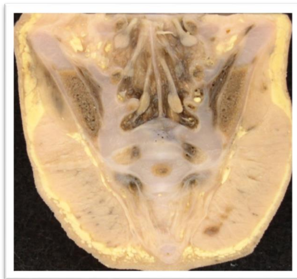
Рис. 5. Фронтальний зріз тазу плода 350,0 мм ТКД. Вид зверху. Макропрепарат. Зб. х 2,0: 1 – тіло II крижового хребця; 2 – крижові спинномозкові нерви; 3 – точка скостеніння у тілі крижового хребця; 4 – крило клубової кістки; 5 – великий сідничний м'яз

і крижовому відділах. У шийній частині ці сплетення набувають драбинчасту будову – складаються з поперечних вени, що сполучають їх поздовжні вени. Вени розташовані спереду крижового відділу, йдуть в поперечному напрямі і утворюють мережу, сполучаючи між собою бічні та при середні крижові вени. Нарешті ділянок передхребтові вени виражені дуже слабо. Заднє зовнішнє сплетення розвинене краще переднього. Внутрішньо-кісткові вени формуються в ядрах скостеніння тіла і дуг хребців. Розташування їх аналогічно артеріям. У тілі хребця є три групи судин: передньо-бічні, радіальні і основно-хребтові. Останні виходять з тіла хребця на передньо-бічний і задній поверхні і вливаються в зовнішні і внутрішні венозні сплетення хребта.