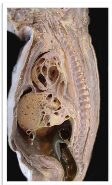
Рис. 1. Серединний сагітальний зріз плода 300,0 мм ТКД. Вигляд з лівого боку. Макропрепарат. 1 – поперекові хребці; 2 – крижові хребці; 3 – куприкові хребці; 4 – міжхребцевий отвір; 5 – вогнище енхондрального скостеніння в тілі крижового хребця; 6 – спинний мозок; 7 – пряма кишка

Хребці мають характерні вікові відмінності (рис. 2). Тіла овальної форми, сплюснуті в сагітальному напрямі, їх поперечні розміри більше поздовжніх (співвідношення між відповідними діаметрами складає 5:3).