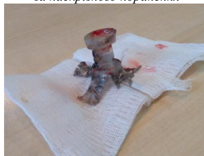
Рис. 2. Пластмасовий контейнер патрона, що був видалений у хворого Г. за допомогою вульнероскопії