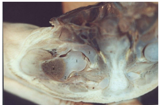
Рис. 1. Фронтальний зріз ділянки кульшового суглоба плода 140,0 мм ТКД. Макрофото. Зб. 3,5: 1 – головка стегнової кістки; 2 – великий вертлюг стегнової кістки; 3 – верхня стінка кульшової западини; 4 – процеси скостеніння в метафізі стегнової кістки; 6 – зв'язка головки стегнової кістки