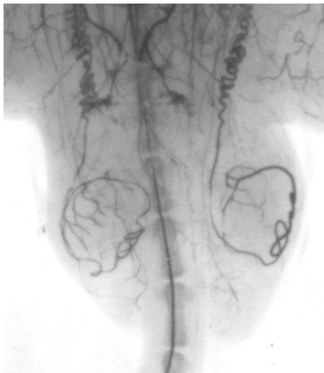
Рис. 1. Рентгенангіограма яєчок щурів на першу добу дозованої компресії сім'яного канатика

За проведення аналізу кількісних показників контрастних рентгенангіограм нами було встановлено, що у контрольній групі тварин величина коефіцієнта асиметрії ( H_2 ), по мірі галуження судини, зростала і на другому рівні біфуркацій він був на 18% більшим ніж на попередньому першому. Така ж ситуація спостерігалася з кутами відхи-