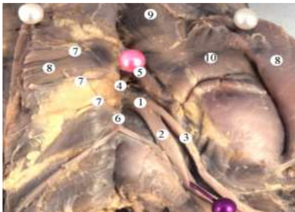
Рис. 2. Права сіднична ділянка плода 290,0 мм ТКД. Макропрепарат. Зб. 2,2х: 1 – сідничний нерв; 2 – великогомілковий нерв; 3 – загальний малоогомілковий нерв; 4 – підгрушоподібний отвір; 5 – грушоподібний м'яз; 6 – нижній сідничний нерв; 7 – нижні сідничні судини; 8 – великий сідничний м'яз; 9 – середній сідничний м'яз; 10 – малий сідничний м'яз.

верхній третини та розташовується в товщі або на поверхні нерва.