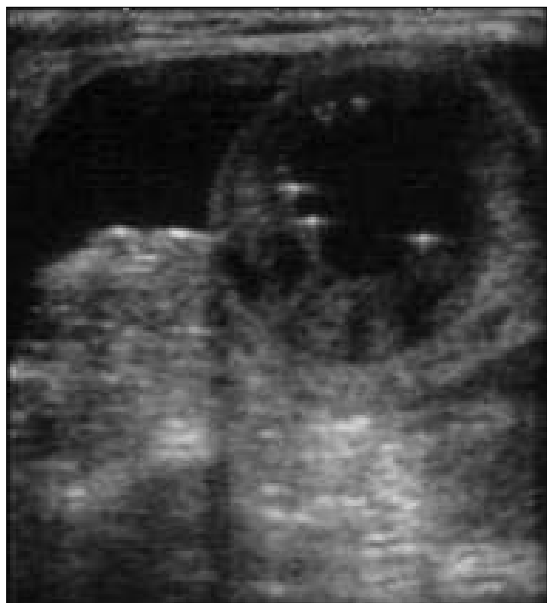
Рис. 2. Ультразвукове дослідження: грижа білої лінії живота; вміст грижового мішка – кишковою петля.

простору не відрізняється на рівнях під МВ ( 0,99 \pm 0,78 см) і надлобкової ділянки ( 0,93 \pm 0,57 см). Майже однакова вона і на рівнях Іbc, пупка та Іbs. У лобковій ділянці передочеревинний простір ( 0,93 \pm 0,38 см) товстіший, ніж на рівнях Іbc ( 0,7 \pm 0,47 см) та Іbs ( 0,74 \pm 0,57 см).